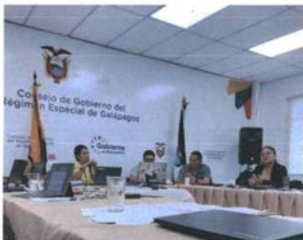
Lunes, 28 de agosto de 2023