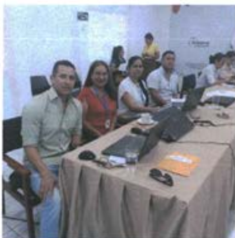
Martes, 29 de agosto de 2023