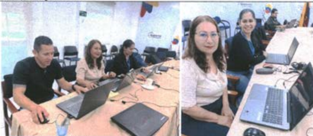
Miércoles, 30 de Agosto de 2023