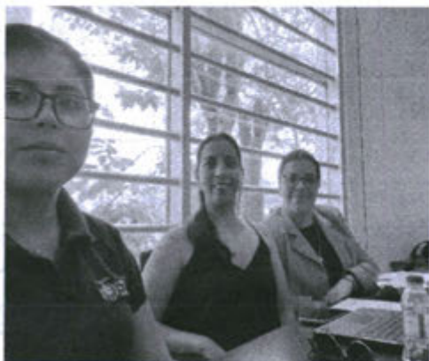
05-09-2023 Santa Cruz- Sala de sesiones del ABG.