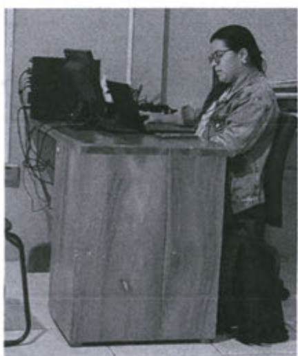
06-09-2023 Isabela - Dirección Distrital de Isabela