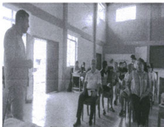
06-09-2023 Isabela - Sala de sesiones del CGREG