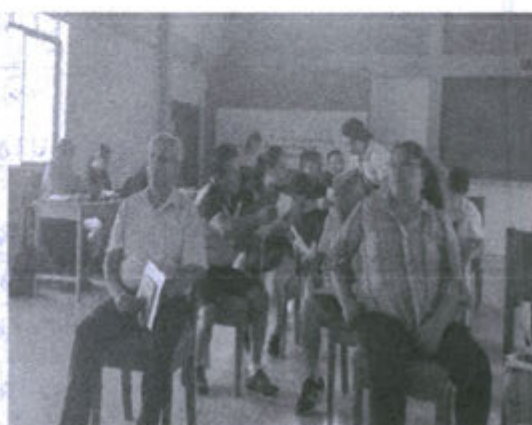
06-09-2023 Isabela- Sala de sesiones del CGREG