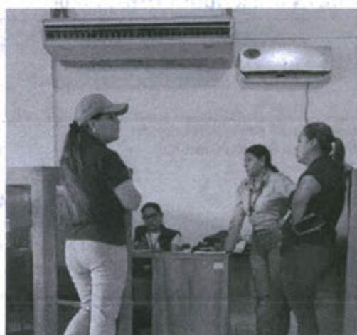
07-09-2023 Isabela - Dirección Distrital de Isabela