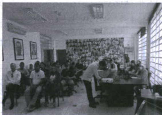
05-09-2023 Santa Cruz- Sala de sesiones del ABG.