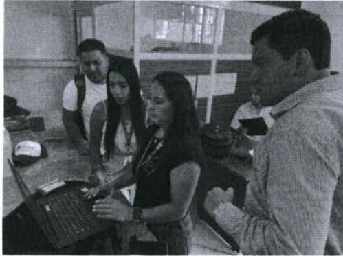
Seguimiento a compromisos preparatorios del evento de Rendición de Cuentas 2022