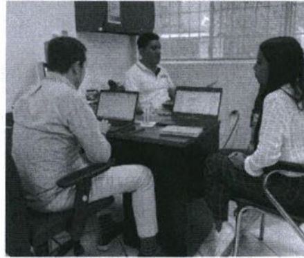
Reunión de trabajo por comisión de servicios institucionales en Santa Cruz – Agenda de DGTAR