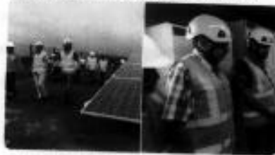
ELLEGALARMOS S.A. y 8 más

Gobierno Galapagos @GobiernoGalapagos · 8 feb ISCALAPAGOS | @normanwray junto a @gustavo vicomina @Rocheluzuri @verificaron que la planta eléctrica de Itoachi este en perfectas condiciones, garantizando el servicio de electricidad. Itoachi cuenta con una planta fotovoltaica de 1 megawatt de energía limpia.