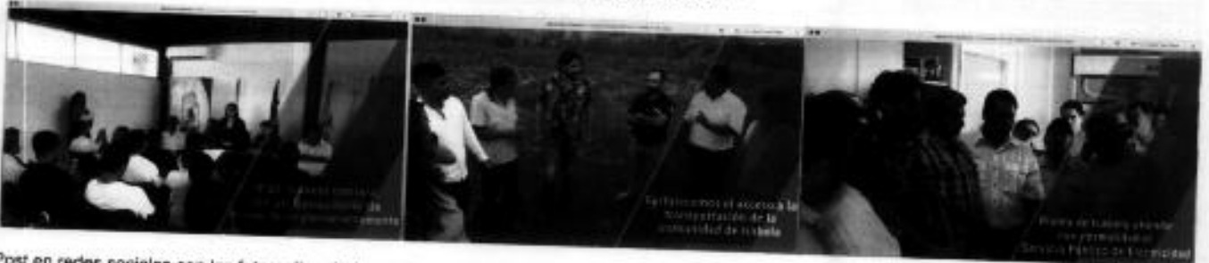
Post en redes sociales con las fotografías de las actividades realizadas por el ministro Norman Wray en Isabela. ✓

Gobierno Galapagos @GobiernoGalapagos · 8 feb ISABELA | Con presencia del Ministro @normanwray, la @Presidencia y el @GobiernoGalapagos se realizaron las actividades para la implementación de un Dispensario Médico Asistido con el propósito de ampliar sus servicios para beneficiar a cerca de 900 personas.