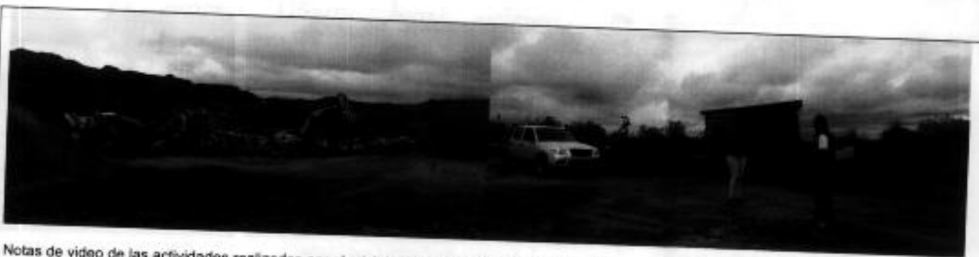
Notas de video de las actividades realizadas por el ministro Norman Wray en Isabela. ✓