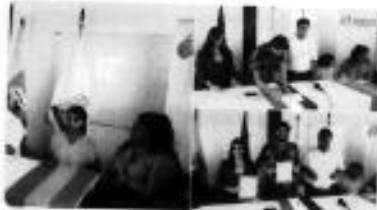
888 y 8 más

Gobierno Galapagos @GobiernoGalapagos · 8 feb ISABELA | Con presencia del Ministro @normanwray, la @Presidencia y el @GobiernoGalapagos se realizaron las actividades para la implementación de un Dispensario Médico Asistido con el propósito de ampliar sus servicios para beneficiar a cerca de 900 personas.